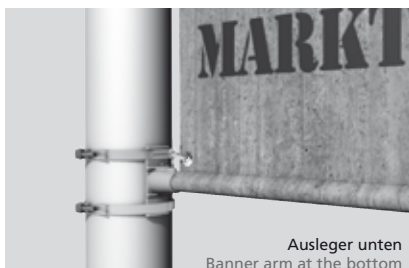
Ausleger unten Banner arm at the bottom