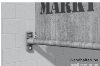
Wandhalterung Wall mounting

Street Banner Basic können im Innenbereich sowie im Außenbereich bis zu einer Windstärke von 5-6 Bft (30-45 km/h) eingesetzt werden.