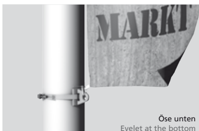
Öse unten Eyelet at the bottom